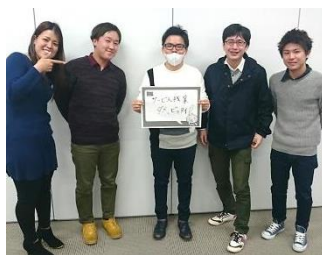
Bグループ 「サービス残業 ダメ、ゼツタイ！」