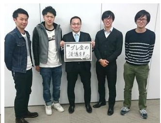
Dグループ 「プレ金の浸透を!!」