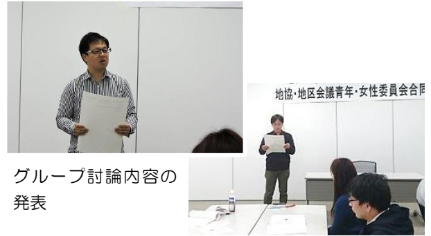
グループ討論内容の発表

討論では出された課題に対し、どうすれば解決につながっていくのかについても話し合い、「取り組みがあまりできてない委員会は、他の委員会のイベントに参加する」「若い人がやっていることをアピ