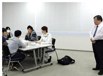
講演の最後にグループで企画を考える

そして、講演の最後に「青年委員会で企画しよう！」というテーマのもとグループワークを行い、青年委員会の運動を盛り上げるための企画を考え、レクリエーションや学習会を企画することの楽しさや、企画段階で出てくる課題について学習しました。