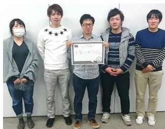
Aグループ 「No 残業でお家に帰ろう♡」

合同学習会参加者もグループごとにメッセージを作成し、撮影した写真をホームページにアップしました。