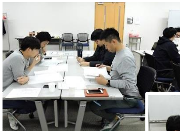
青年委員会運動を盛り上げるためにグループ討論