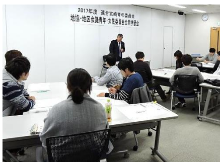
講演に聞き入る参加者

①労働組合の必要性では、組合の力があることで会社側と同じ目線で話ができるが、組合がないところでは経営者から「明日から来なくていい」等と理不尽なことを言われたり、労働者が賃上げも言えないといった厳しい実態があることを話されました。改めて、自分たちが労働組合のある職場で働いていることを再認識し、賃金や職場環境、そして生活を守るために必要不可欠な組織であることを学びました。